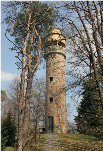
Sattelbergturm auf dem Sattelberg bei Seelen (2011)