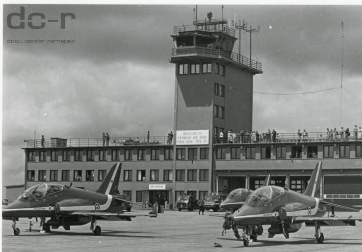
Ehemaliger Flugplatz Air Base Sembach