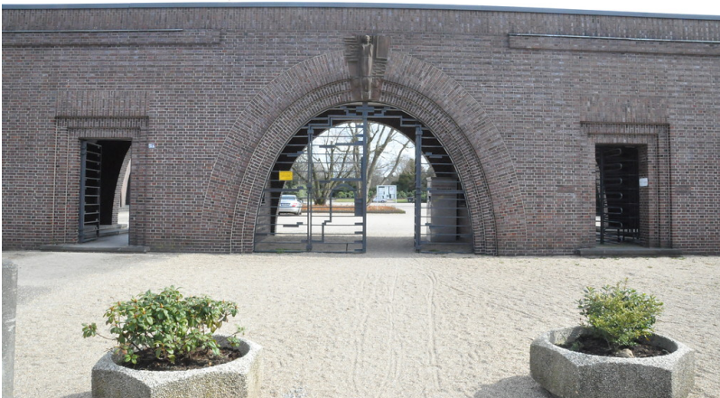
Südwestfriedhof in Fulerum (2018)