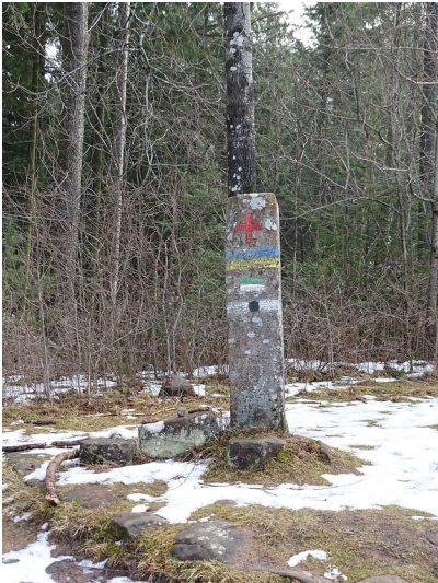
Der Messpunkt am Gipfel des Steigerkopfes (2018).