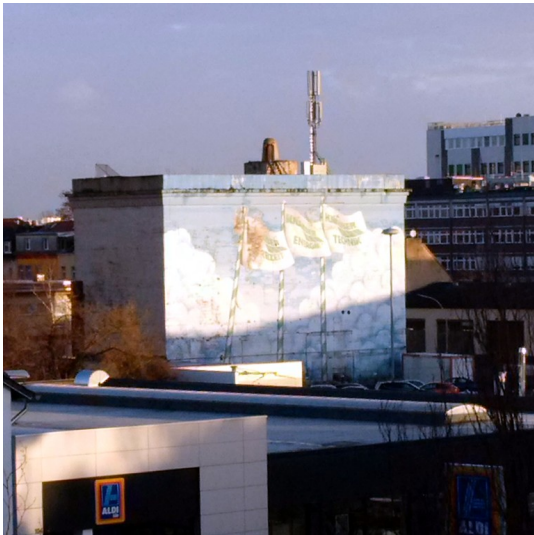
Der im Jahr 2015 abgerissene Hochbunker in der Bonner Weststadt / Karlstraße (2015)