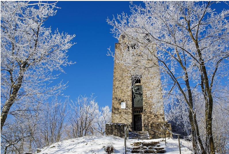
Winterlicher Blick auf den Kaiser-Wilhelm-Turm auf der Hohen Acht bei Adenau in der Eifel (2016).