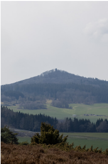
Hohe Acht bei Adenau (2021)