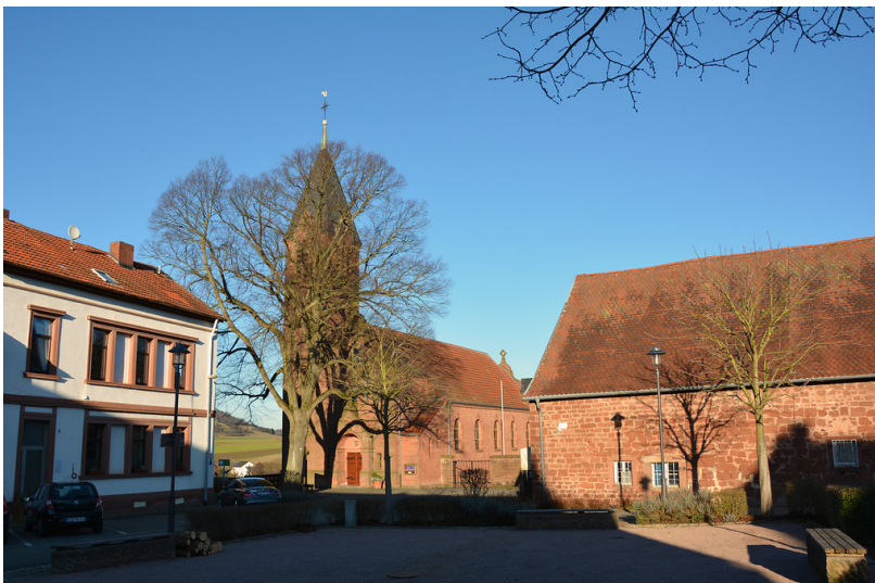
Blick auf die Protestantische Kirche vom ehemaligen Klostergelände (2018).