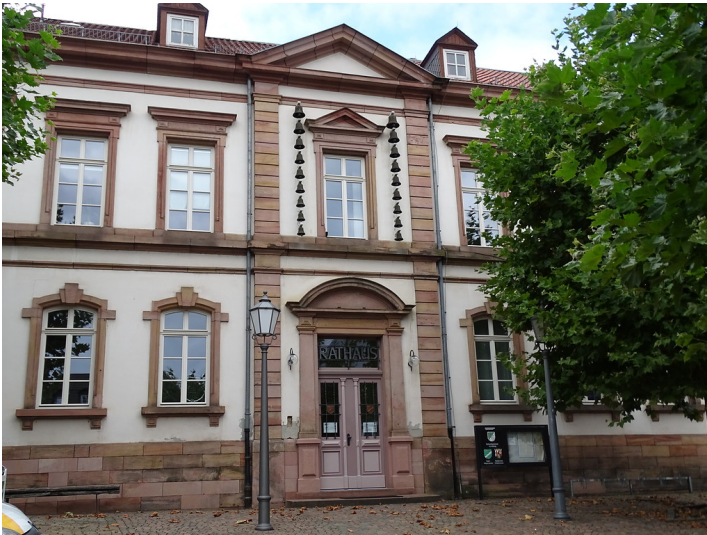
Vorderansicht des Rathauses in Kusel (2018).