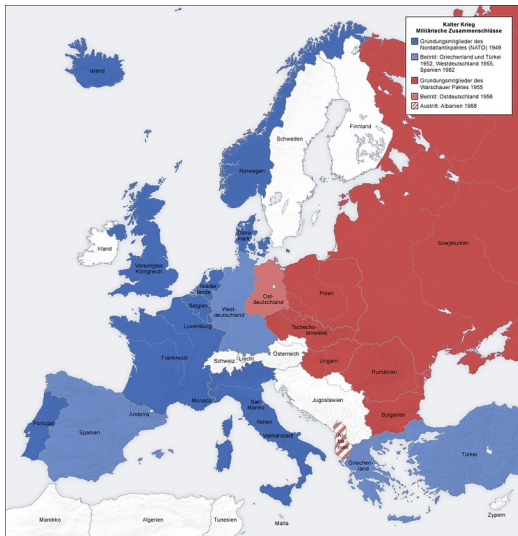
Karte zu den militärischen Bündnissen in Europa während des Kalten Krieges: In Blau die NATO-Staaten, in Rot die Länder des Warschauer Paktes.