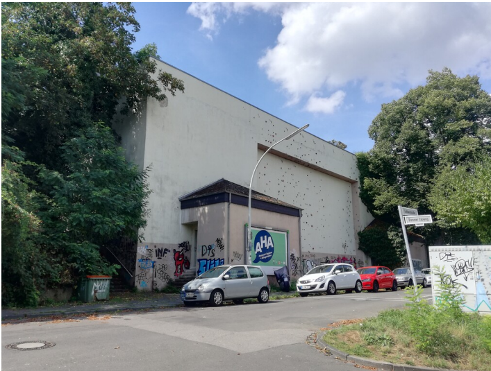
Hochbunker in Bonn-Kessenich (2020)