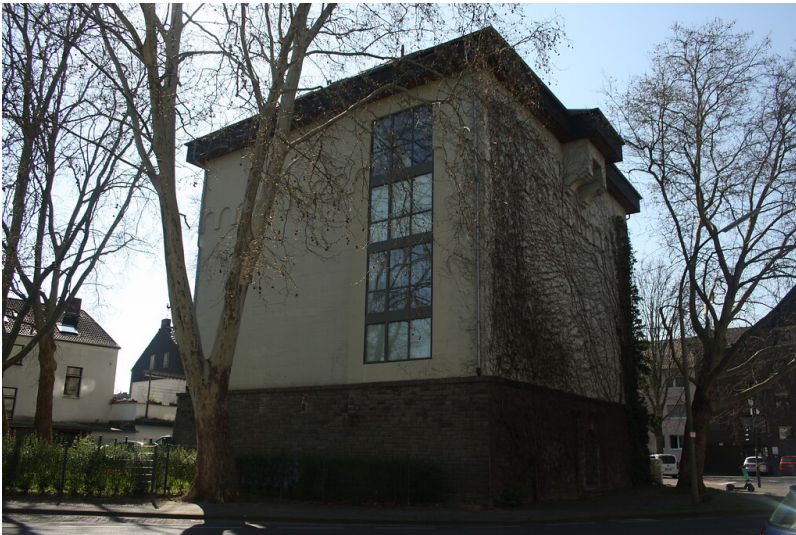
Hochbunker in der Goetheallee in Beuel (2020)