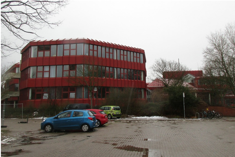
Integrierte Gesamtschule Bonn-Beuel, unter der Turnhalle rechts im Hintergrund liegt die Bunkeranlage Hilfskrankenhaus Bonn-Beuel (2018).