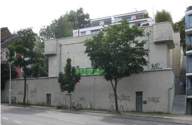
Der frühere Hochbunker in der Trierer Straße in Bonn-Poppelsdorf, der später als Studentenwohnheim genutzt wurde (2016).