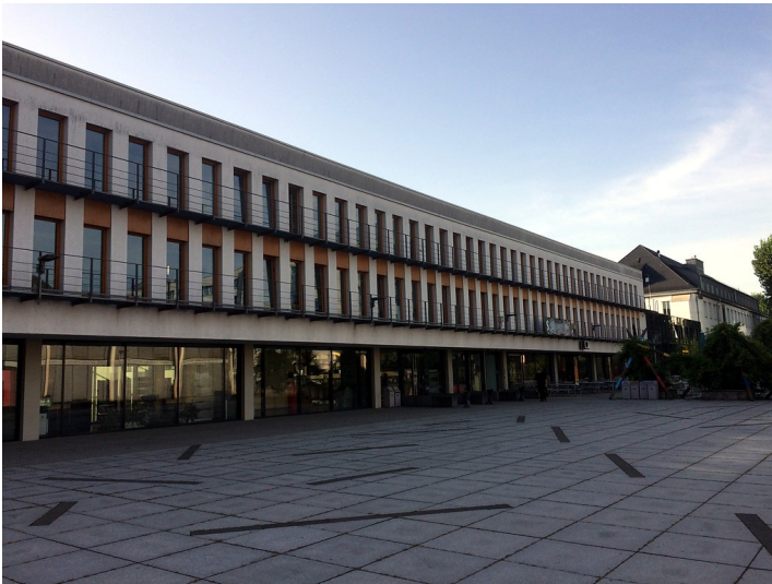
C-Gebäude des Campus Koblenz der Universität Koblenz-Landau (2017).