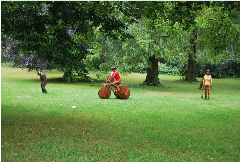
Blick in den Skulpturenpark im Schlosspark Köln-Stammheim (2014).