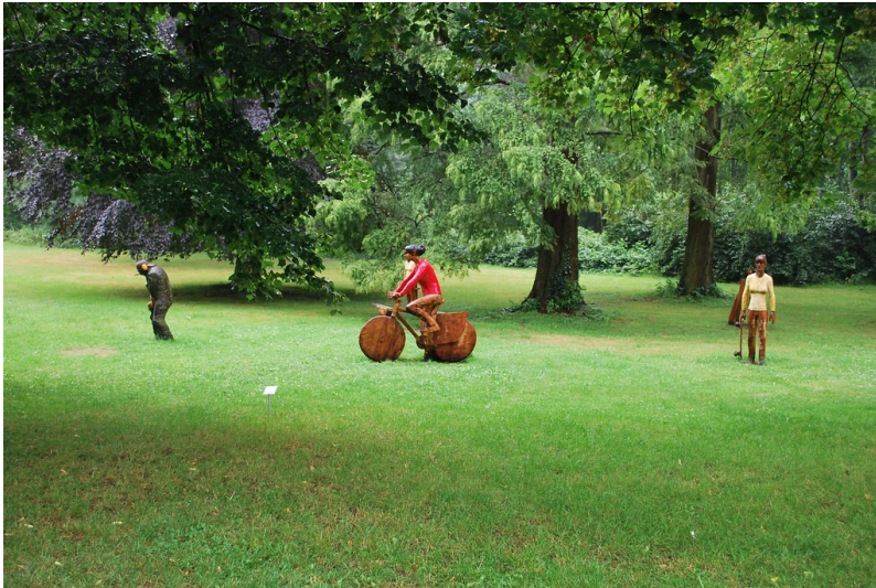
Blick in den Skulpturenpark im Schlosspark Köln-Stammheim (2014).