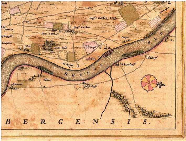
Ausschnitt eines Kupferstichs von Joan Blaeu (1596-1673), die auf 1663 datierte Karte "Descriptio Agri Civitatis Coloniensis" zeigt die Umgebung von Köln.