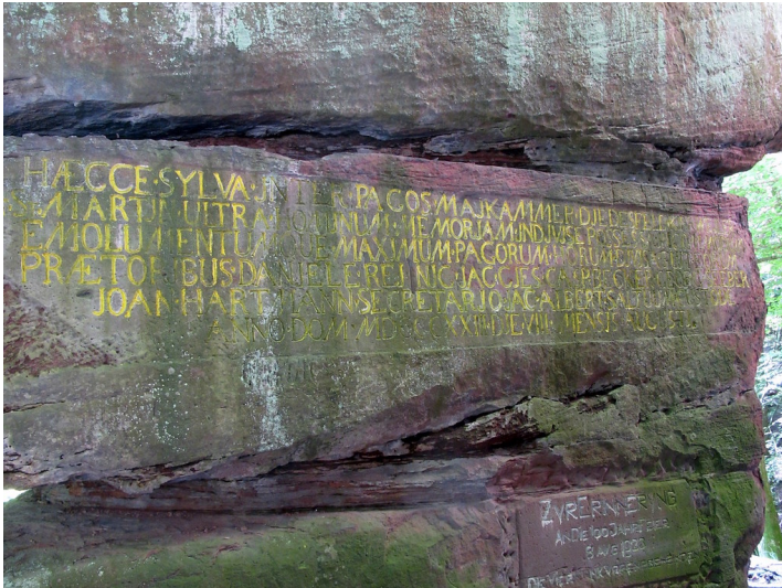
Inscription auf dem Kanzelfelsen am Kanzelberg (2016)