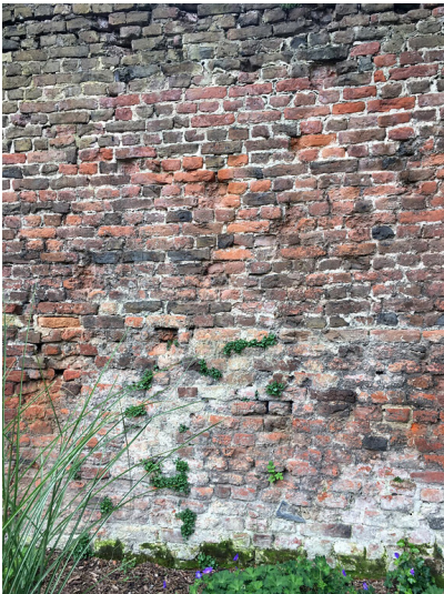
Stadtmauer in Uerdingen an der Turmstraße (2018)