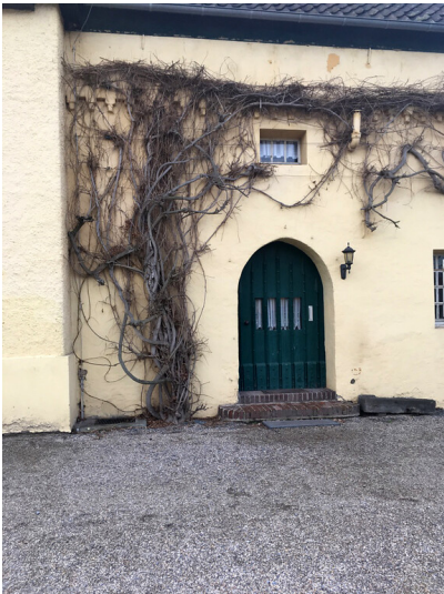
Mauern und Hofgebäude an der Vorburg von Burg Linn (2018)