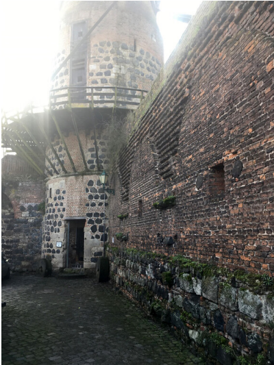
Mauern an der Mühle an der Südwestseite der Stadt Zons (2018)