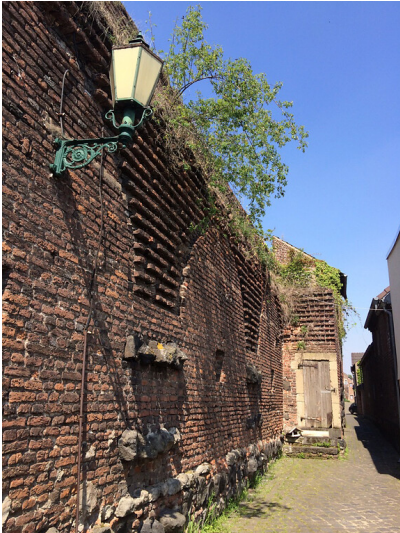
Innenseite der westlichen Außenmauer der Stadt Zons (2018)