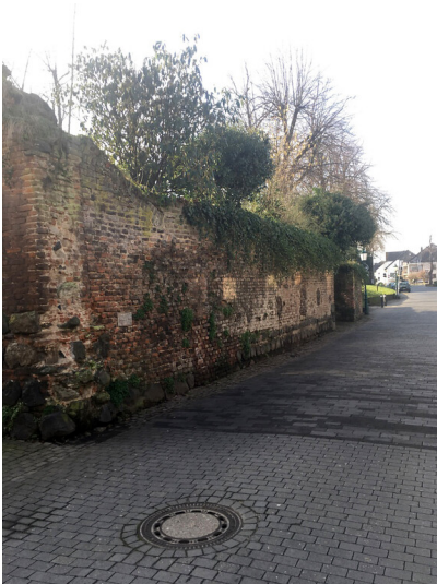
Mauer an der Schloßstraße in Zons (2018)