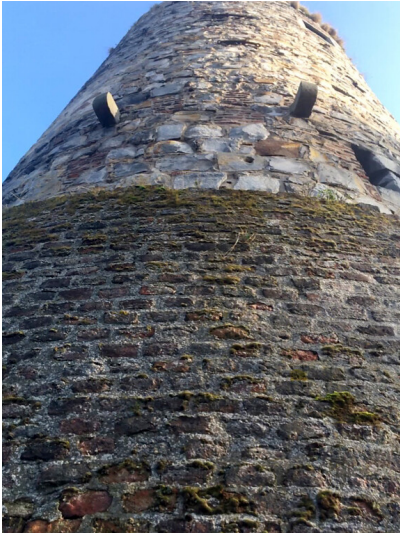
Mühlenturm in Liedberg (2018)