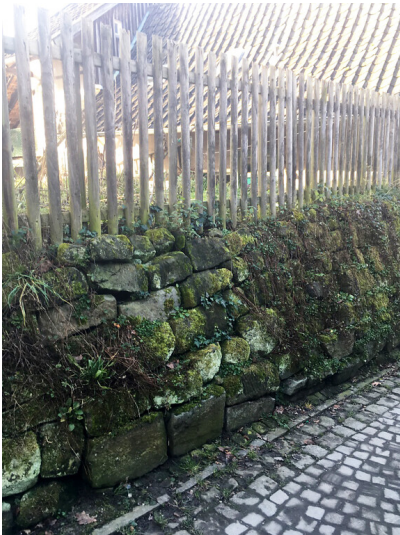
Mauer an der Mühlengasse in Liedberg (2018)