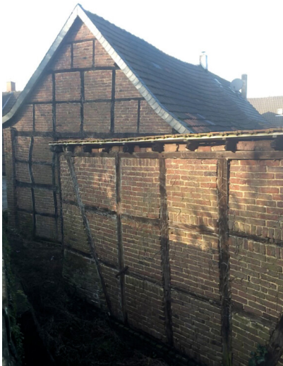
Fachwerkhaus vor der Brücke zu Schloss Liedberg (2018)