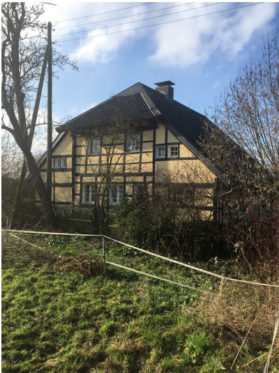
Fachwerkhaus bei Raderbroich (2018)