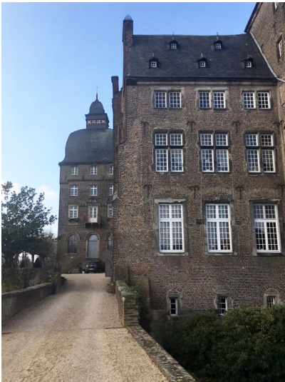
Mauern von Schloss Myllendonk (2018)