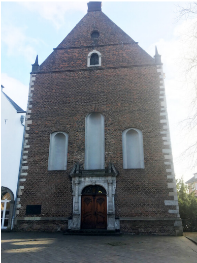
Zeughaus am Markt in Neuss (2018)