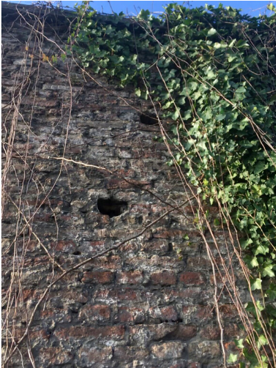
Stadtmauer Neuss (2018)