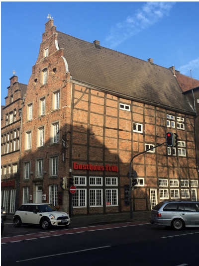
Fachwerkhaus an der Michaelstraße in Neuss (2018)