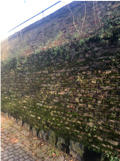
Mauer an Sebastianusstr Neuss (2018)