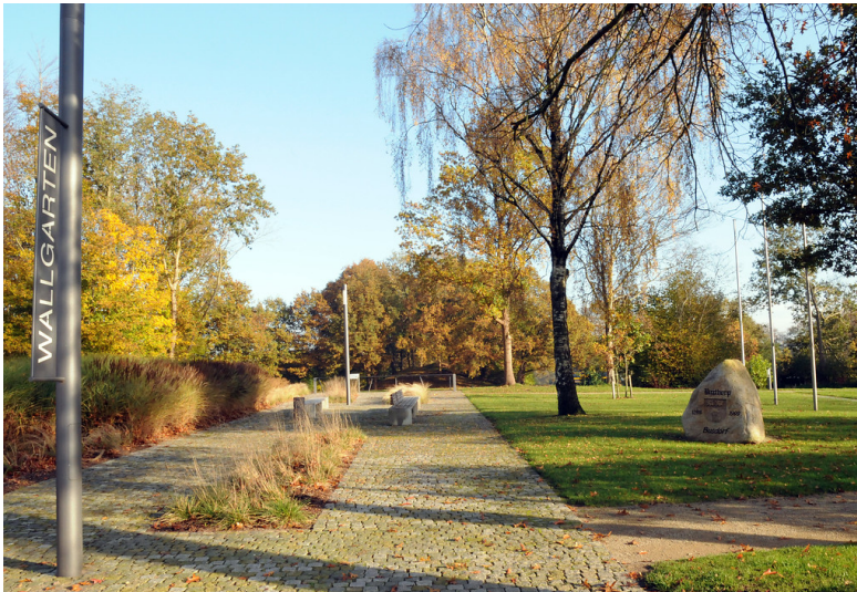
Der Wallgarten in Busdorf als Teil des Freiraumkonzeptes für den Verbindungswall des Danewerks (2015)