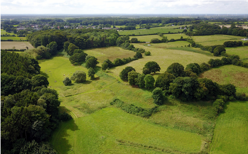
Luftbildaufnahme der Thyraburg aus Südosten (2017)