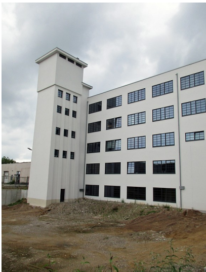
Der Wasserturm der Sidol-Werke in Braunsfeld ist heute Bestandteil eines Wohn- und Gewerbekomplexes (2018).