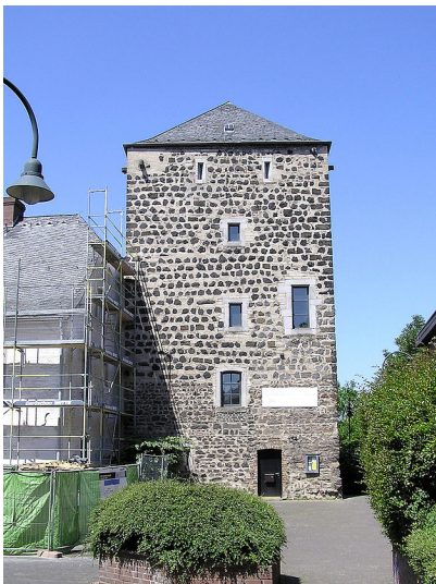
Wohnturm mit Heimatmuseum in Köln-Zündorf (2006), vermutlich aus der zweiten Hälfte des 13. Jahrhunderts