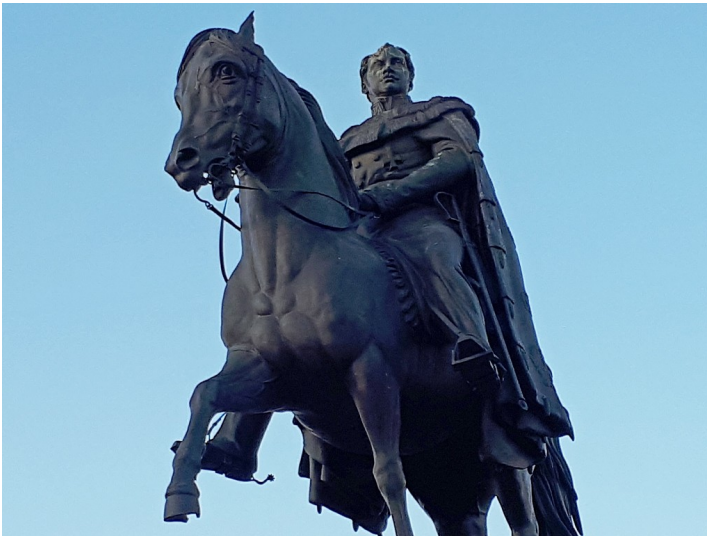
Reiterstandbild des preußischen Königs Friedrich Wilhelm III. auf dem Kölner Heumarkt (2018)