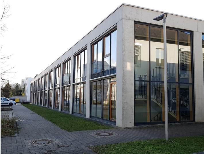
Sporthalle des Campus Koblenz der Universität Koblenz-Landau (2017)