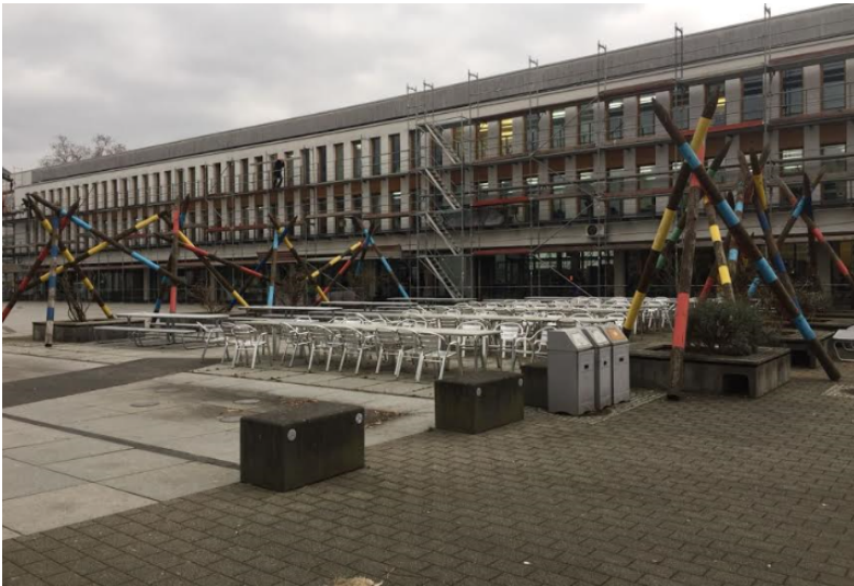
Mikadoplatz des Campus Koblenz der Universität Koblenz-Landau (2017). Fotograf/Urheber: Lena-Maria Tempelhagen