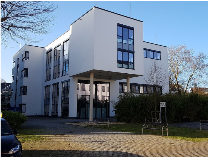
M-Gebäude des Campus Koblenz der Universität Koblenz-Landau (2017).