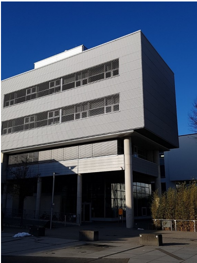
Ansicht von Süden auf den Eingangsbereich des G-Gebäudes auf dem Campus Koblenz der Universität Koblenz-Landau (2017).