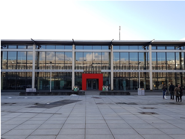
Östliche Ansicht der Universitätsbibliothek des Campus Koblenz der Universität Koblenz-Landau (2017).