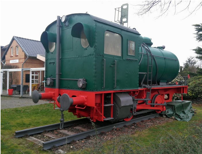
Dampfspeicherlokomotive Typ Henschel 28963 aus dem Baujahr 1947 auf dem Gelände des ehemaligen Kleinbahnhofs Ost in Elsdorf, im Hintergrund das „Café DampfloK“ (2018).