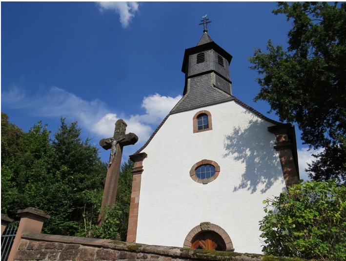
Westansicht der Rochuskapelle in Kaiserslautern Hohenecken. Links daneben ist eine Jesusfigur an einem großen Steinkreuz zu erkennen (2013).