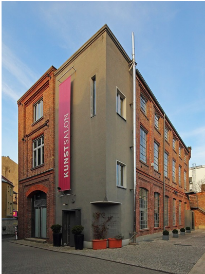
Das 1900 als Kupferschmiede errichtete und 1996 zum Kulturzentrum "KunstSalon" umgebaute Fabrikgebäude in der Siedlung Mannsfeld im heutigen Köln-Raderberg (2012)