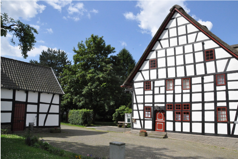
Weißes Pferdchen in Hohkeppel (2014)