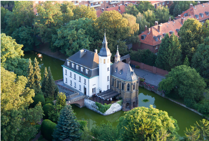
Luftaufnahme einer Ballonfahrt von dem Wasserschloss Weißhaus in Köln-Sülz an der Luxemburger Straße (2010).