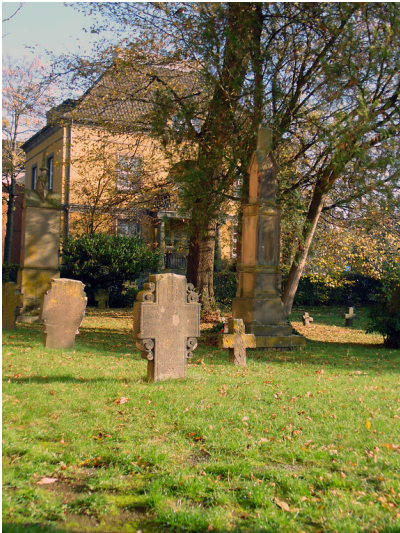
Historische Grabsteine auf dem nicht mehr genutzten Friedhof am Krieler Dörmchen in Köln-Lindenthal (2020), dem ältesten Friedhof Kölns. Blick in Richtung des einstigen Krieler Hofes.