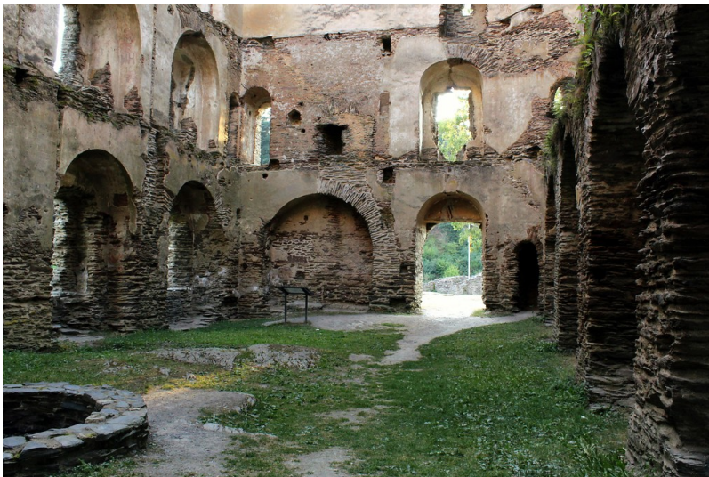
Blick von Osten auf das Innere des Wohnturmes der Burgruine Balduinseck (2018).