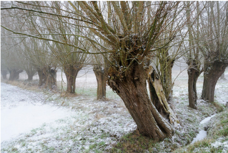
Kopfweidenreihe in Nettetal-Hinsbeck (Voursenbeek)